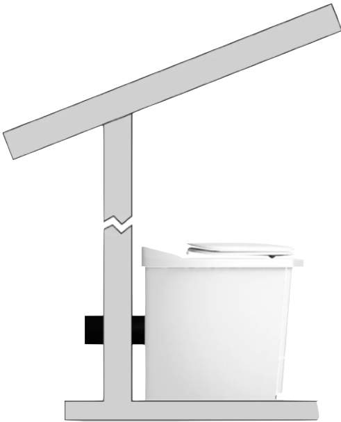
INSTALLATION MED FRÅNLUFTSRÖRET GENOM VÄGG OCH VENTILATIONS-GALLER PÅ UTSIDAN