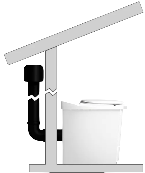
REKOMMENDERAR ATT GÅ UPP NÅGON METER MED RÖRET, DET GÅR UTMÄRKT ATT STANNA MED REGNHATTEN INNAN TAKFOT